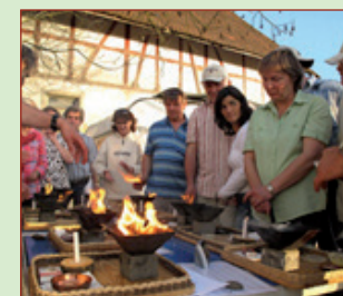
Агнихотра бива теоретически и практически обяснена.

Хома стопанството е един вид показно стопанство, което съществува преди всичко благодарение на доброволния труд и подкрепа чрез членове на дружеството и дарения. Ние сме благодарни за всяка помощ, която допринася за разпространението на агнихотра. Ето защо ви каним най-сърдечно да ни подкрепите, да учим заедно, да трупаме заедно опит и да го споделяме един с друг, да се заредим с енергия... Радваме се да ни посетите.