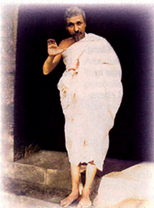
Param Sadguru Shree Gajanan Maharaj

In nahezu allen Voraussagen wird Kalki, der Herr des Universums, als ein mächtiger, junger Mann beschrieben, auf einem weißen Pferd reitend (symbolisch für Reinheit und Macht) und mit einem leuchtenden Schwert in der Hand (symbolisch für den Licht-Willen und als Waffe, mit der er das Dunkel besiegt). Seine Augen leuchten wie Feuer. Er wird gegen das Dunkel kämpfen und die ewige Religion, wie sie in den Veden verankert ist, wiederherstellen.